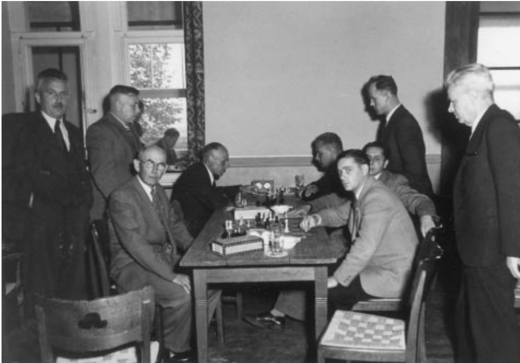
Turm Lage zu Gast bei einem Detmolder Schachverein.

am 9. April überlegt man einen "Städtewettkampf" durchzuführen, und am 30. April wird der Beitritt zum Westfälischen Schachbund beschlossen. Mit Schreiben vom 17. Juli wird dieser Beitritt noch präzisiert durch die Bekanntgabe der Vorstandsmitglieder an den Verband. Dabei ist die Bezifferung der Mitgliederzahl mit 10 bemerkenswert, da diese Zahl etwa der durchschnittlichen Teilnehmerzahl der wöchentlichen Übungsabende entspricht.